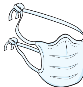
Máscara Cirúrgica (paciente durante o transporte)